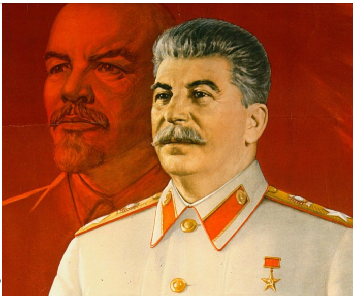
Vladimiro Lenin e Joseph Stalin

Attenzione che se ti prende la mano poi finisci veramente alla trasmissione "I Nuovi Mostri" di Striscia la Notizia!